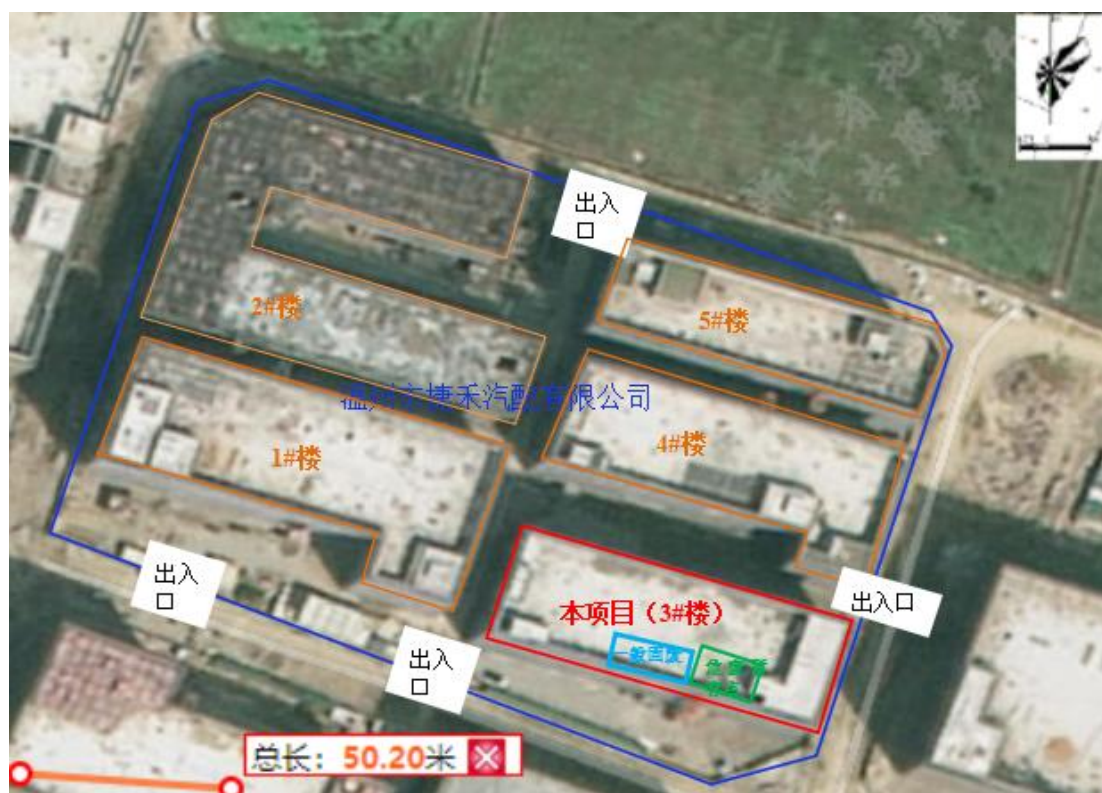
图 2-1 总平面布置图