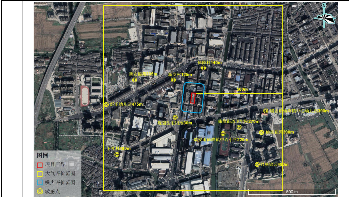
图 3-1 环境保护目标示意图