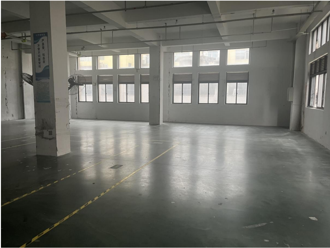
图 2-2 项目厂房现状图