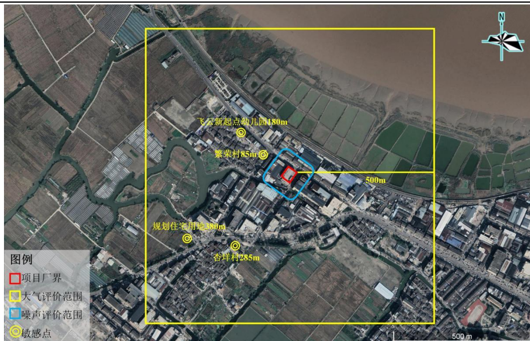
图 3-1 环境保护目标示意图