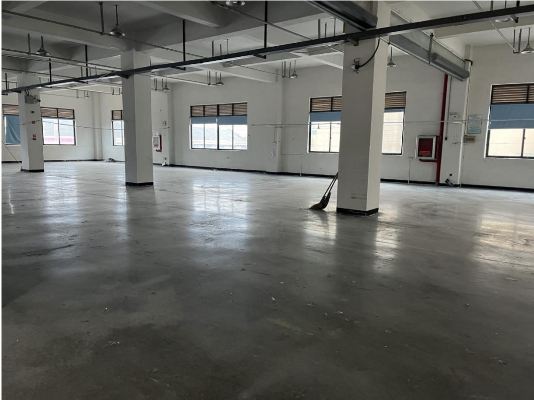
图 2-2 项目厂房现状图

项目属于新建项目，企业利用空置厂房作为生产用房，不涉及土建，故不存在与项目有关的原有污染情况及主要环境问题。