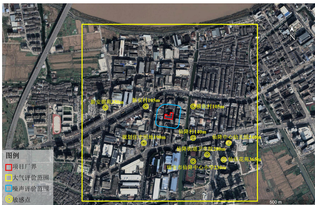
图 3-1 环境保护目标示意图