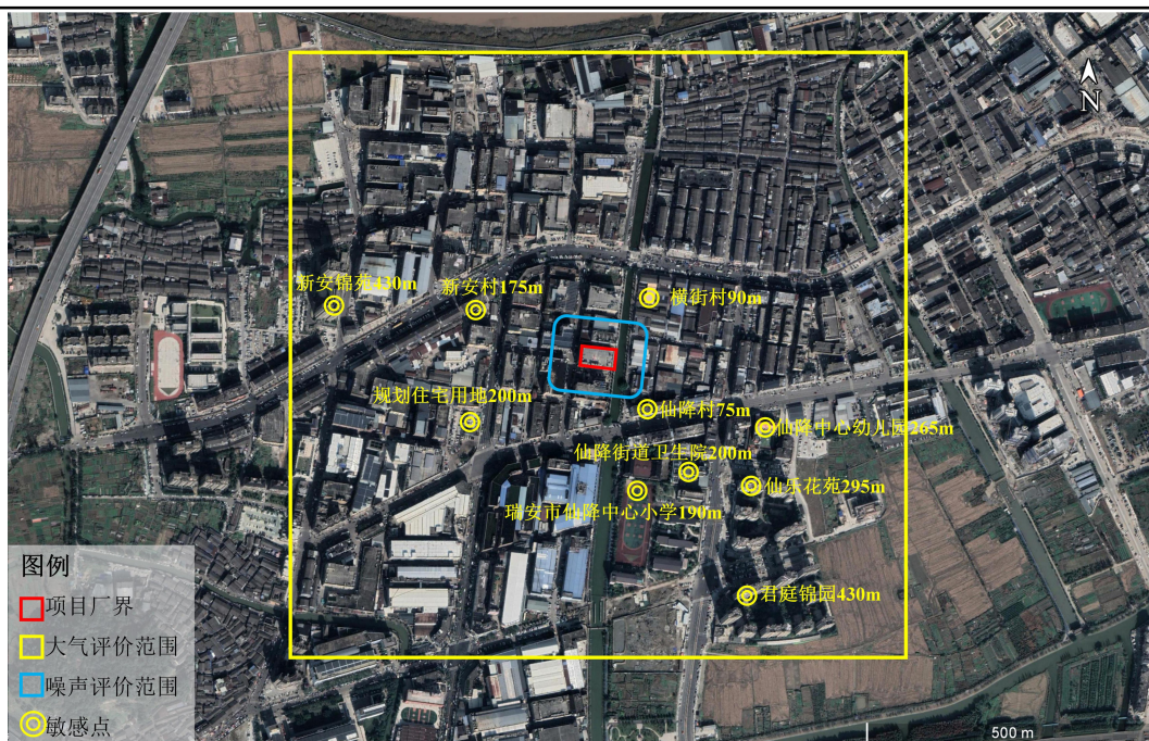
图 3-1 环境保护目标示意图