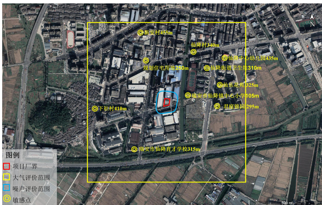
图 3-1 环境保护目标示意图