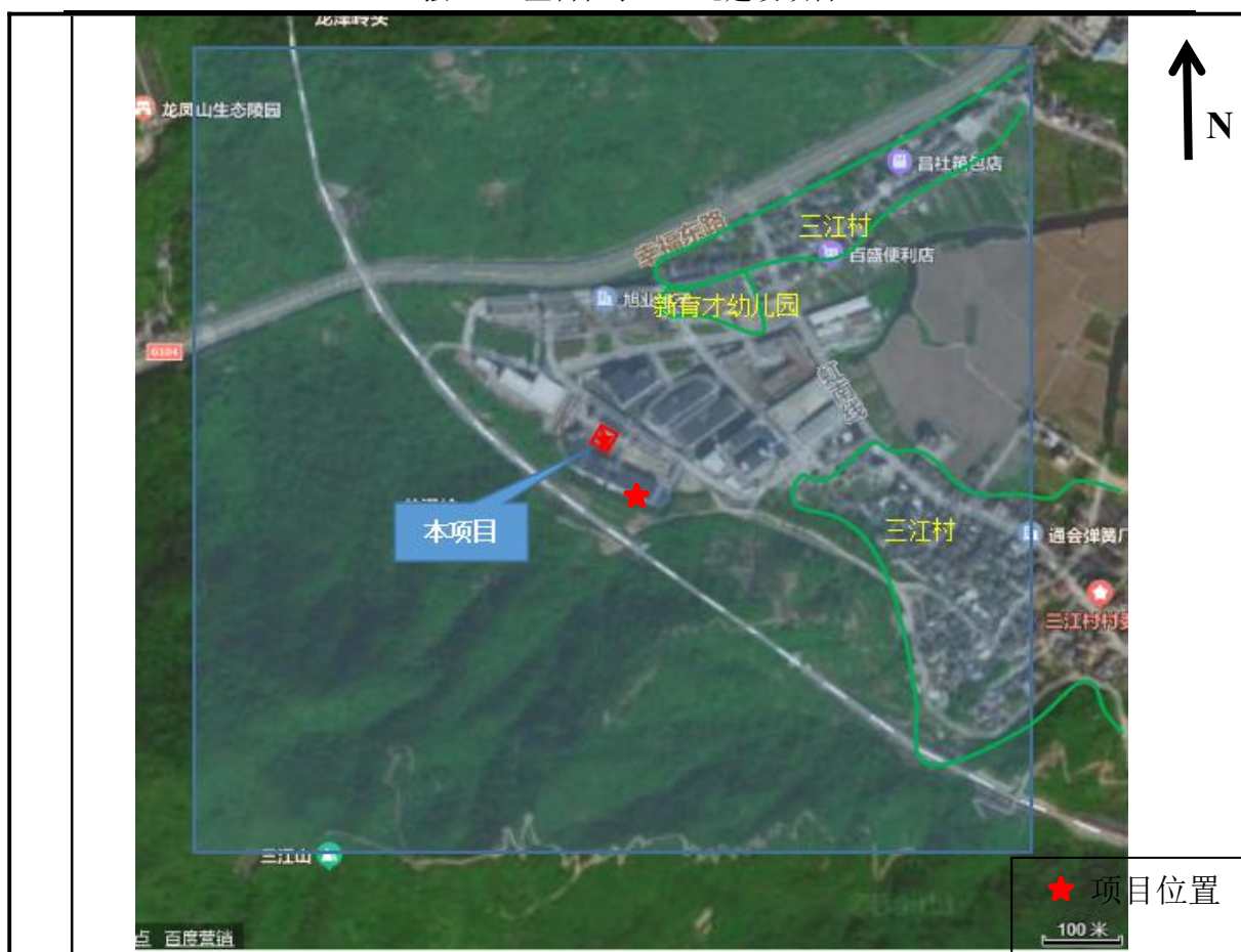
图 3-3 周边环境敏感点分布图