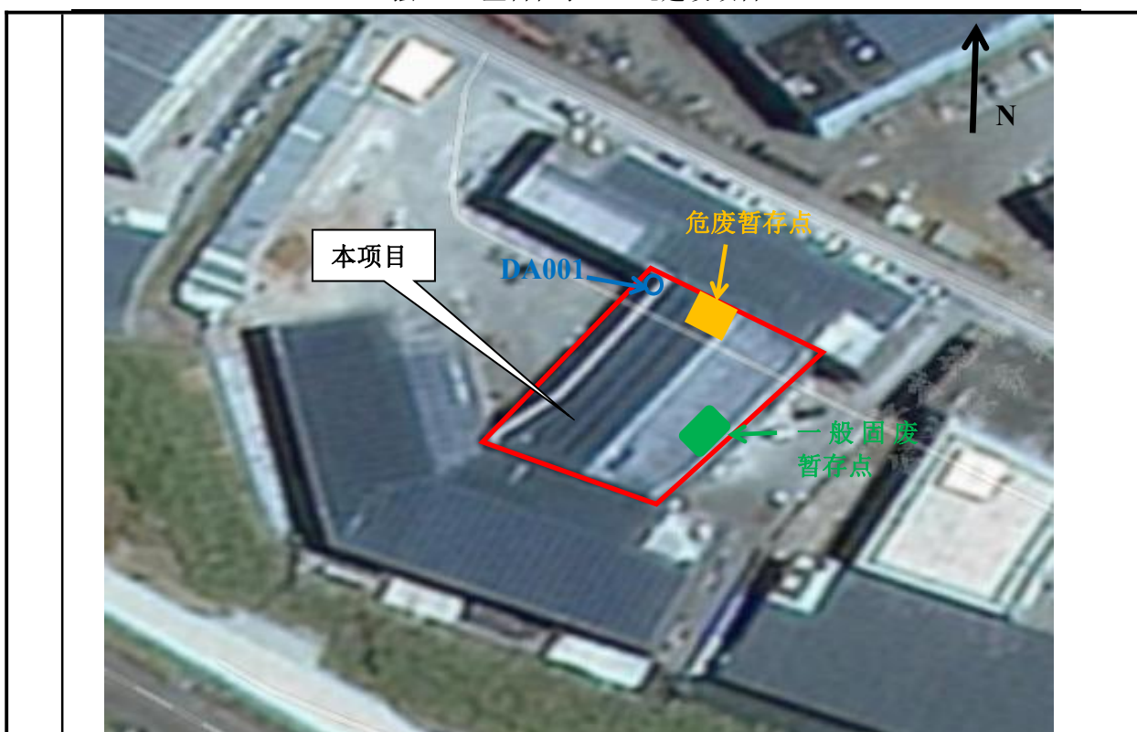
图 2-1 厂区平面图