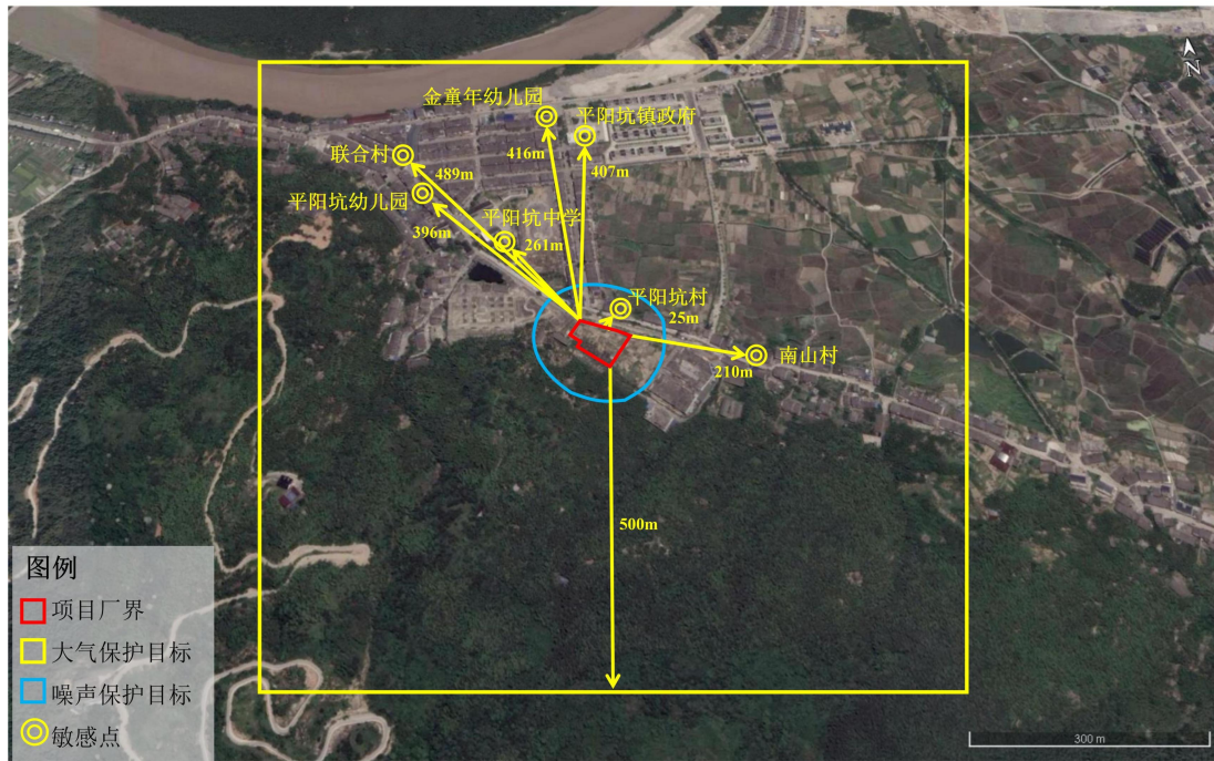
图 3-1 环境保护目标示意图